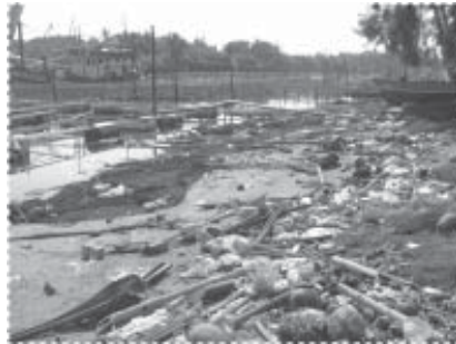
สภาพริมน้ำก่อนเริ่มโครงการ