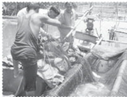
ช่วยกันจับปลาฉลามแดง ของโครงการที่เลี้ยงในกระชัง

สวัสดิการชุมชนที่เข้มแข็ง และมีอาชีพใหม่ที่เหมาะสม” ดำเนินการแบบบูรณาการ โดยเน้นการมีส่วนร่วมของประชาคม มุ่งประเด็นด้านการพัฒนาต่อยอดกิจกรรมเดิมที่มีอยู่แล้วด้านจัดการทรัพยากรธรรมชาติ และสิ่งแวดล้อม การดูแลสุขภาพกายและใจ การสร้างความเข้มแข็งและสมานฉันท์ให้แก่ประชาคม และเสริมความเข้มแข็งทางด้านการพัฒนาและสร้างอาชีพใหม่ และอาชีพเสริมอย่างจริงจัง พร้อมทั้งการแก้ไขปัญหาสังคมโดยเฉพาะปัญหายาเสพติด โดยมีแผนงานต่างๆ 7 แผนงาน ประกอบด้วยโครงการต่างๆ 30 โครงการ ดำเนินงานเป็นระยะเวลา 18 เดือน งบประมาณที่ได้รับอนุมัติทั้งสิ้น 766,000 บาท และงบประมาณที่จ่ายจริงทั้งสิ้น 588,090 บาท ประสบผลต่างๆ พอที่จะประมวลได้ดังนี้ คือ