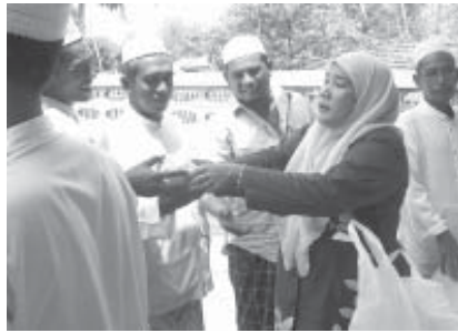
อามีเนาะ กำลังสำคัญ

ของสมาชิกจากการเป็นผู้มีบุคลิกภาพประนีประนอม มีเหตุมีผล และมีทักษะด้านการใช้ภาษา คือ การไกล่เกลี่ยข้อพิพาทและแก้ไขปัญหาและข้อขัดแย้งต่างๆ ในชุมชน