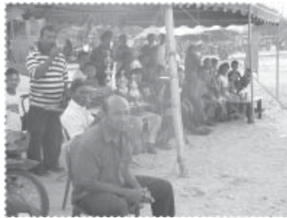
บรรยากาศการแข่งขันกีฬา