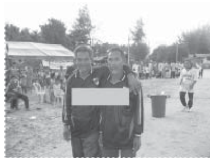
เราแฮปปี้...รุ่นนี้เล่นกีฬา