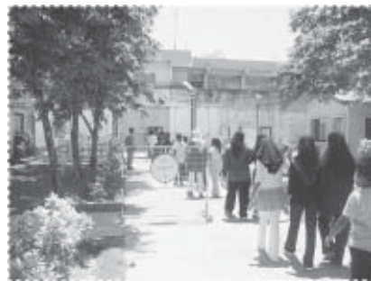
เยี่ยมชมเรือนจำกลางสงขลา

สมาชิกในครอบครัว การจัดกิจกรรมครอบครัวสัปดาห์ กิจกรรมการดูแลและให้ความ ความอนุเคราะห์เด็กกำพร้า พิการ หรือด้อยโอกาสอื่นๆ กิจกรรมการดูแล ผู้สูงอายุ กิจกรรมการจัดระบบสวัสดิการชุมชน การแก้ไขปัญหาความขัดแย้ง โดยสันติวิธี และกิจกรรมการป้องกันการเข้าสู่การติดยาเสพติดในเยาวชน โดยการจัดกิจกรรมต่างๆ เช่น ฝึกอบรมการป้องกันยาเสพติด และเข้าเยี่ยมชม เรือนจำกลางสงขลา การจัดค่ายพัฒนากีฬาฟุตบอลยุวชน พร้อมจัดส่งทีมเข้า แข่งขันระดับตำบลและอำเภอ จัดสัมมนาเชิงปฏิบัติการ เพื่อให้เชื่อมั่นในการ แก้ไขปัญหาความขัดแย้งโดยสันติวิธี จัดกิจกรรมทัศนศึกษาเพื่อให้ชุมชนเกิด ความสามัคคี และใช้การจ้างงานพัฒนาเป็นเครื่องมือในการแก้ไขปัญหาโดย สันติวิธีในชุมชน การมีคณะผู้อาวุโสของชุมชนที่ทำหน้าที่พยายามเชื่อมประสาน รอยร้าวที่เกิดขึ้นระหว่างแกนนำของโครงการกับผู้ใหญ่บ้านคนใหม่ การส่งตัวแทน ผู้นำชุมชนเข้าร่วมศึกษาเชิงลึกการดำเนินงาน “สภาชุมชน” เพื่อนำมาปรับใช้ใน หมู่บ้านป่าตาบาระ การเข้มงวดกับ การจำหน่ายยาเสพติดในชุมชนโดย ผู้ใหญ่บ้าน และการป้องกันการเข้าสู่ ยาเสพติดของเยาวชน โดยการเข้า เยี่ยมชมสภาพความเป็นอยู่ภายใน เรือนจำกลาง จังหวัดสงขลา การ สนับสนุนทางด้านกีฬา การจัดประชุม สัมมนา และการกระตุ้นผู้ประกอบการ เป็นต้น อย่างไรก็ตามปัญหายาเสพติด ของชุมชนยังคงปรากฏมีอยู่ โดยเฉพาะ ในหมู่วิัยรุ่น และเป็นเรื่องที่ยาก ที่สุดที่จะดำเนินการแก้ไขให้หมดสิ้น ลงได้