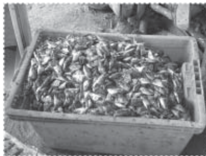
หัวปลาที่เหลือ เปลี่ยนเป็นเงินผู้สวัสดิการชุมชน

ชุมชนที่เป็นรูปธรรมอย่างแท้จริง สร้างความมั่นคงทางรายได้ และภูมิใจในความสำเร็จให้แก่ชุมชนปาตาบาระแห่งนี้เป็นอย่างมาก ปัจจุบันโรงงานต้นแบบแห่งนี้ได้เป็นสถานที่ศึกษาดูงาน ทั้งโดยชุมชนใกล้เคียงและชุมชนอื่นๆ จากภูมิภาคต่างๆ ทั่วประเทศ และต่อมาได้รับการคัดเลือกจากศูนย์อำนวยการบริหารจังหวัดชายแดนภาคใต้ (ศอ.บต.) ให้เป็นโรงงานต้นแบบด้านการผลิตอาหาร เพื่อพัฒนาต่อยอดสู่การเป็นแหล่งผลิตอาหารฮาลาลชุมชน โดยสนับสนุนงบประมาณจำนวน 1.2 ล้านบาท