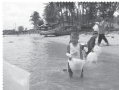
ปล่อยแล้ว...โตขึ้นทูบจะจับกิน