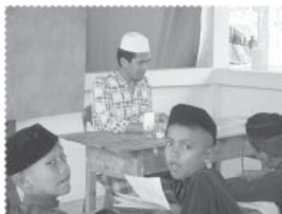
ครูสอนโรงเรียนตาดีกา