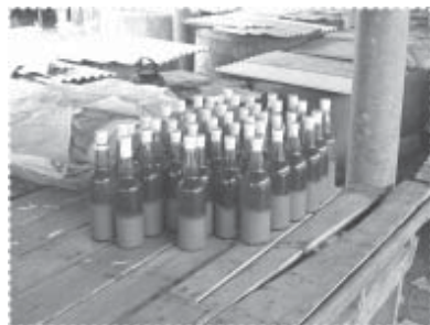
บูดู...ผลิตภัณฑ์ที่ขึ้นชื่อ

คือ อุทกภัยครั้งใหญ่ ทำให้บ้านเรือนเสียหายได้รับความเดือดร้อนจำนวนมาก มัสยิดเดิมที่เคยมีได้จมลงไปในแม่น้ำ ทำให้ต้องมีการอพยพที่อยู่อาศัยทั้งชั่วคราว และถาวร โดยผู้คนส่วนหนึ่งอพยพไปอาศัยยังบ้านปาตาตีมอ ตำบลตะลุบัน อำเภอสายบุรี สืบเชื้อสายมาจนถึงปัจจุบัน