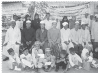
เราไม่มีพ่อแม่