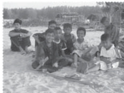
เตรียมเล่นฟุตบอล

ไม่เพียงประสงค์ การแข่งขันกีฬาประเพณีสำหรับผู้อาวุโสของหมู่บ้าน การแข่งขันกีฬาของชุมชน การร่วมสนับสนุนเพื่อปรับปรุงสนามกีฬาของหมู่บ้าน การร่วมคิดและพัฒนาโครงการเพื่อจัดสร้างสนามกีฬาฟุตบอลและลานออกกำลังกายที่มีสภาพสมบูรณ์