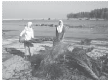
ทำความสะดวกชุมชน