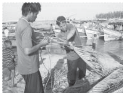
เตรียมการประกอบซั้ง