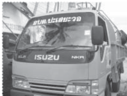
ร่วมสร้างกระแสผลักดันจนได้คันนี้สำหรับขนขยะ

เพื่อใช้ในการกำจัดขยะบางชนิดต่อไป โครงการได้ดำเนินการหาวิธีเพื่อนำ น้ำให้มีการ เลิกและลดการสูบบุหรี่ ของชาวบ้าน โดยสามารถผลักดัน ให้ผู้นำศาสนาทั้งสามตำแหน่ง คือ อิหม่าม คอเต็บ และบิลาล เลิกบุหรี่ โดยเด็ดขาด นอกจากนั้น ยังมีชาวบ้าน