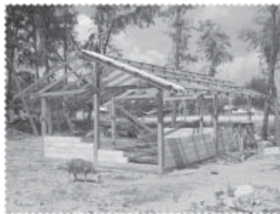
☞ โรงงานข้าวเกรียบเริ่มปรับปรุง ปี 2549

โรงงานข้าวเกรียบต้นแบบ ระบบการผลิตและบริหารจัดการที่สอดคล้องกับวิถีชีวิตชุมชน เริ่มต้นจากการดำเนินงานในโครงการระยะที่ 1 และการสนับสนุนงบประมาณบางส่วนจากศูนย์ศึกษาและพัฒนาสันติวิธี มหาวิทยาลัยมหิดล ร่วมกับโครงการจัดตั้งสถาบันสมุทรรัฐเอเซียตะวันออกเฉียงใต้ ศึกษา มหาวิทยาลัยสงขลานครินทร์ ด้วยเงินลงทุนเพียง 30,000 บาท ในปี 2549 เพียงแค่สองปีหลังจากนั้น ปัจจุบัน (ธันวาคม 2551) โรงงานแห่งนี้มียอดการผลิตเฉลี่ยประมาณเดือนละ 600,000 บาท หรือคิดเป็น 7.2 ล้านบาทต่อปี สร้างงานให้ชาวบ้านได้มากกว่า 20 คน และงานต่อเนื่องอีกจำนวนมาก และผลกำไรที่ได้รับในแต่ละปีนำไปจัดสรรเป็นระบบสวัสดิการชุมชน นับว่าเป็นโมเดลการพัฒนาวิสาหกิจชุมชนที่เริ่มต้นจากชาวบ้าน เจริญก้าวหน้าอย่างมั่นคง และชุมชนเป็นเจ้าของอย่างแท้จริงเพียงแห่งเดียวของจังหวัดชายแดนภาคใต้ สามารถเป็นต้นแบบของการพัฒนาจังหวัดชายแดนภาคใต้ระดับชุมชนในสถานการณ์ปัจจุบันได้อย่างดียิ่ง