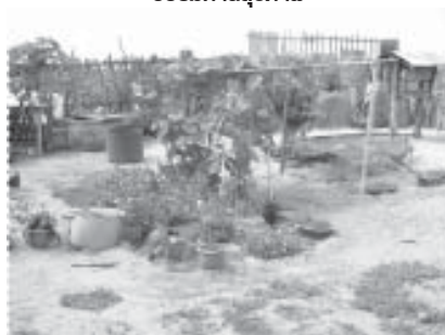
หลังบ้านมีผักสวนครัว ใครว่างก็มาเอาปลูกผักไม่ขึ้น

ของผู้อาวุโส กลุ่มแม่บ้าน การก่อตั้งชมรมกีฬาของหมู่บ้านเพื่อจัดส่งทีมกีฬาไปเข้าร่วมการแข่งขันยังที่ต่างๆ การริเริ่มการแข่งขันกีฬาฟุตบอล ประเพณีภายหลังวันเฉลิมฉลองวันตรุษอีดิลฟิตรี เพื่อป้องกันมิให้เยาวชนออกจากหมู่บ้านไปร่วมกิจกรรมที่