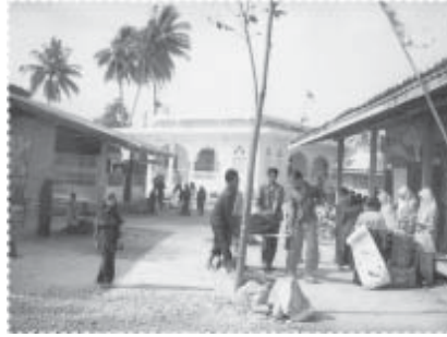
ช่วยกันพัฒนาปรับปรุงมัธยมระยะแรกๆ