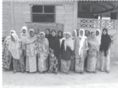
ผู้รับสวัสดิการ