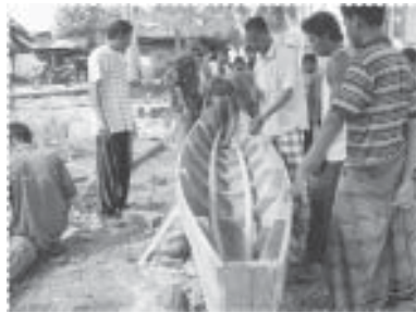
ช่วยกันสร้างเรือพาย

วันตรุษฮิดลฮัจญ์ ซึ่งดำเนินการมาอย่างต่อเนื่องจากการริเริ่มจัดเป็นครั้งแรกในโครงการระยะที่ 1 การแข่งขันกีฬาประเพณีสำหรับผู้อาวูโสของหมู่บ้าน การแข่งขันกีฬาของยุวชน การผลักดันให้องค์การบริหารส่วนตำบลปรับปรุงสนามกีฬาประจำหมู่บ้านให้มีสภาพที่ดีขึ้น การรื้อฟื้นประเพณีการแข่งขันเรือพาย โดยจัดส่งทีมของหมู่บ้านไปแข่งขันยังพื้นที่ต่างๆ จนล่าสุดได้รับรางวัลรองชนะเลิศอันดับที่ 2 จากการแข่งขันเรือพาย (เรือยอกก็อง) ซึ่งถวายพระราชทาน