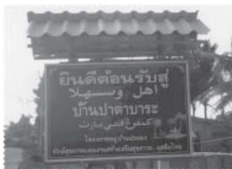
ป้ายชื่อโครงการหมู่บ้านประมงรักษ์สุขภาพ...ชั้นตราหน้าทางเข้าหมู่บ้าน

มีการกล่าวกันว่าชุมชนบ้านปาตาบาระ เริ่มก่อตั้งขึ้นราว 200 กว่าปี ทั้งนี้เป็นการประเมินโดยใช้วิธีเทียบเคียงกับการก่อเกิดของ “วัดบางตะโล๊ะ” หรือ “วัดถัมภาวาส” ตั้งอยู่ ณ บ้านบางตะโล๊ะ หมู่ที่ 3 ตำบลปะเสยะวอ ชุมชนไทยพุทธเชื้อสายจีนและมีพื้นที่ติดกันกับหมู่บ้านปาตาบาระ ซึ่งมีหลักฐานระบุว่า มีอายุมากกว่า 200 ปี อย่างไรก็ตามการตั้งชุมชนในระยะแรกอาจจะเป็นการตั้งที่ไม่ถาวร ตามวิถีชีวิตของผู้คนที่ใช้ทะเลเป็นแหล่งทำมาหากิน มักจะอพยพโยกย้ายตามความสมบูรณ์ของทรัพยากร และการเข้าถึงแหล่งน้ำจืดของพื้นที่อยู่ตลอดเวลา ด้วยตำแหน่งที่ตั้งที่อยู่บริเวณปากแม่น้ำสายบุรี ทางฝั่งทิศเหนือของปากแม่น้ำสายบุรีที่มีต้นกำเนิดจากเทือกเขาในพื้นที่อำเภอแว้ง และอำเภอสุดคิริน