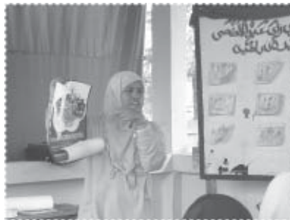
อบรมด้านสุขภาพ

วันละมากกว่า 1 ชอง ทำหน้าที่เป็นฟรีเซ็นเตอร์ในการอธิบายเหตุผลของการเลิกสูบบุหรี่ไปยังแหล่งที่มีการชุมนุมของชาวบ้าน และโครงการได้ใช้เทคนิคสุดท้ายในการป้องกันการหวนกลับเข้าไปสู่อหู่หรืออีก คือ การให้ของขวัญเป็นผ้าถุงให้แก่ผู้เลิกสูบบุหรี่ มีร้านค้าของชำในหมู่บ้านจำนวนหนึ่งร้านเข้าร่วมโครงการ ร้านนี้ไม่ขายบุหรื โครงการได้ผลักดันให้ชาวบ้านปรับเปลี่ยนพฤติกรรมมารบริโภค โดยเฉพาะการให้มีส่วนผสมของผักเข้ามาเป็นอาหารมากขึ้น โดยใช้วิธีกระตุ้นหลายรูปแบบ เช่น การปลูกผักสวนครัวหลังบ้าน แม้จะมีอาณาบริเวณไม่มากนัก การรณรงค์การรับประทานผักโดยผ่านกิจกรรมของเยาวชน การทำอาหารที่ทำให้ผักมีความน่ารับประทานมากขึ้น ภายหลังจากโครงการสนับสนุนและสร้างกระแสให้มีการออกกำลังกาย พบว่า ชาวบ้านจำนวนมากหันมาให้ความสนใจสุขภาพด้วยวิธีการออกกำลังกายในรูปแบบต่างๆ เช่น การเดินออกกำลังกาย