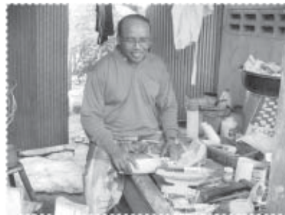
ส่งเสริมอาชีพใหม่ ทำเรือถ่ายตัดจาลอง

เพิ่มรายได้บางส่วนให้แก่ครูสอนศาสนาที่สอนในโรงเรียนตาดีกา ทำให้หนุนเสริมและสร้างกำลังใจในการที่จะอบรมบ่มนิสัยของเยาวชนของหมู่บ้านสืบไป นอกจากนี้ การเลี้ยงปลาโดยใช้หลักวิชาการ มีการบันทึกข้อมูลต่างๆ อย่างเป็นระบบ จะช่วยเป็นแนวทางสำคัญสำหรับปรับปรุงการบริหารจัดการฟาร์มเลี้ยงปลาของชาวบ้านต่อไป โครงการได้จัดให้มีการ ทัศนศึกษาดูงาน ต่างๆ ที่คาดว่าจะสามารถดำเนินการได้ในหมู่บ้าน ได้ทำให้เกิดมีผู้ริเริ่ม เลี้ยงปลาเก่าหรือปลากระรัง ในหมู่บ้านขึ้นเป็นครั้งแรก และประสบความสำเร็จทางเศรษฐกิจในระดับที่น่าพอใจอย่างยิ่ง สนับสนุนให้มีการจัดทำ โมเดลเรือประมงพื้นบ้าน จำลองเพื่อจำหน่ายเป็นของที่ระลึก แม่วายังไม่ประสบความสำเร็จทางด้านการตลาดมากนัก แต่การพัฒนา ยังคงดำเนินต่อไป ได้มีการจัดฝึกอบรมการทำอาหารประเภทต่างๆ เพื่อลดรายจ่ายของครัวเรือนให้แก่กลุ่มแม่บ้าน ซึ่งได้รับความสนใจเป็นอย่างยิ่ง โครงการย่อยที่นับว่าประสบความสำเร็จมากที่สุด และ