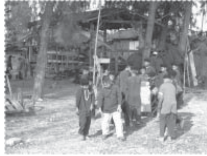
สภาพบริเวณมัธยมในปี 2547