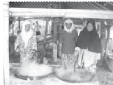
3 สาว มือปรุงอาหาร

ปะเสยะวอ อำเภอสายบุรี ซึ่งจากการดำเนินงานพบว่า ชาวบ้านจำนวนมากยังคงให้ความสนใจสุขภาพด้วยวิธีการออกกำลังกายในรูปแบบต่างๆ เช่น การเดินออกกำลังกายของผู้อาวูโส กลุ่มแม่บ้าน การจัดส่งทีมกีฬาของหมู่บ้านไปเข้าร่วมการแข่งขันยังที่ต่างๆ การแข่งขันกีฬาฟุตบอลประเพณีภายหลังวันเฉลิมฉลอง วันตรุษฮิดลฮัจญ์ การจัดกิจกรรมเชื่อมความสัมพันธ์โดยการร่วมทำอาหาร ร่วมสนับสนุนค่าใช้จ่ายและวัตถุประสงค์ และร่วมรับประทานอาหารใน