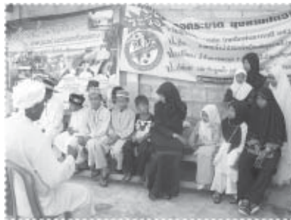
เด็กกำพร้า

การจัดตั้งระบบไฟแนนซ์ชุมชนเพื่อให้ชุมชนมีแหล่งเงินกู้สำหรับใช้ในกิจการต่างๆ ซึ่งในปี 2551 ไฟแนนซ์ชุมชนได้ปล่อยเงินกู้ให้แก่สมาชิกจำนวนประมาณ 300,000 กว่าบาท ครอบคลุมถึงการกู้ยืมเพื่อขยายร้านค้า การกู้ยืมเพื่อนำไปลงทุนขายผัสดอง