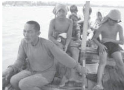
อดีตอิหม่ามมุस्ताฟาร์...เหนื่อยยากเพื่อพวกเขา

บิลดาลประจำชุมชน ต่อมาได้รับการ แต่งตั้งเป็นอิหม่าม และได้ลาออกใน เวลาต่อมา คือ บุคคลสำคัญอีกคน หนึ่งที่ทำให้โครงการประสบความสำเร็จและอยู่ได้อย่างยั่งยืนจนถึง ปัจจุบัน ด้วยความมุ่งมั่นและตั้งใจจริง