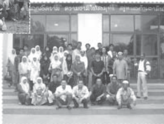
คณะศึกษาดูงาน ภูเก็ต-กระบี่ ☞