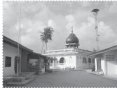
มัธยม...วันนี้

ของสมเด็จพระบรมราชินีนาถ ที่มีต่อพสกนิกรชาวประมงพื้นบ้าน จัดปรับปรุงพื้นที่ต่างๆ รอบๆ หมู่บ้าน โดยจัดสร้างศาลากลางหมู่บ้านเพื่อเป็นแหล่งสังสรรค์และพักผ่อน หรือทำกิจกรรมต่างๆ ด้วยกันของประชาชน โดยที่ปัจจุบันมีการใช้งานศาลาพักผ่อนหลังดังกล่าวสูงมาก ทั้งจากเด็กๆ และผู้มีอายุ ทำให้กลายเป็นศูนย์รวมของประชาชน และโครงการได้จัดนำเอาหนังสือและสื่อต่างๆ มาเก็บไว้ที่ศาลาดังกล่าวเพื่อเป็นแหล่งเรียนรู้ของชุมชน ปรับภูมิทัศน์มัธยมและโรงเรียน ตาติกาประจำหมู่บ้าน ให้มีสภาพที่ดีขึ้นกว่าเดิมอย่างเห็นได้ชัด สมกับการเป็นสถานปฏิบัติศาสนกิจและการอบรมเยวชน พื้นที่หลายๆ จุดของหมู่บ้านที่เดิมที่เคยเป็นสถานที่ทิ้งขยะ ได้รับการปลูกต้นไม้เพิ่มเติม และมีมาตรการห้ามทิ้งขยะอีกต่อไป โครงการยังสนับสนุนและกระตุ้นให้ทุกครัวเรือนมีการจัดสวนหย่อมบริเวณหน้าบ้านหรือหลังบ้าน เพื่อให้บ้านมีความน่าอยู่มากขึ้น โดยที่มีจำนวน