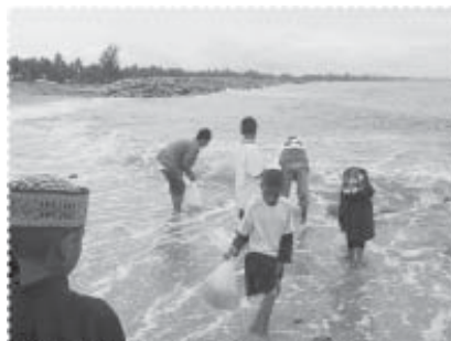
เยาวชนร่วมปล่อยลูกกุ้งลงทะเล

ครัวเรือนที่เข้าร่วมในการจัดหน้าบ้าน/หลังบ้านนามองจำนวนมาก ทำให้เกิดความรู้สึกว่าบ้านเป็นบ้านมากขึ้น และกิจกรรมการตกแต่งบริเวณบ้านดังกล่าวนี้ยังเป็นเครื่องมือที่จะสร้างความรัก และความอบอุ่นภายในครอบครัวได้อีกด้วย โครงการได้ประสานงานกับหน่วยงานของกรมประมงโดยผ่านองค์การบริหารส่วนตำบล เพื่อให้จัดกิจกรรมการปล่อยพันธุ์สัตว์น้ำลงสู่แหล่งน้ำชายฝั่ง เพื่อช่วยกระตุ้นสำนึกทางด้านการอนุรักษ์สิ่งแวดล้อม นอกจากนี้โครงการยังได้เน้นการให้ความรู้เกี่ยวกับสิ่งแวดล้อมผ่านการจัดค่ายเยาวชนรักษ์สิ่งแวดล้อม โดยร่วมมือกับนักศึกษามหาวิทยาลัยสงขลานครินทร์ ภายใต้การดูแลและสนับสนุนทางด้านต่างๆ จากโครงการ จนทำให้โครงการค่ายดังกล่าวได้รับการคัดเลือกเป็นผลงานดีเด่น และหัวหน้าโครงการย่อยดังกล่าว ได้รับการคัดเลือกให้เป็นทูตไบโเฮอร์ด้านสิ่งแวดล้อมของประเทศไทย ประจำปี พ.ศ. 2548