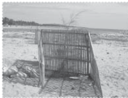
ต้นสนเมื่อแรกปลูก