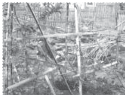
มีผักมากขนาดนี้ที่หลังบ้าน ถ้าจะให้หมดก็กินเองและได้แจกจ่ายให้เพื่อนบ้าน