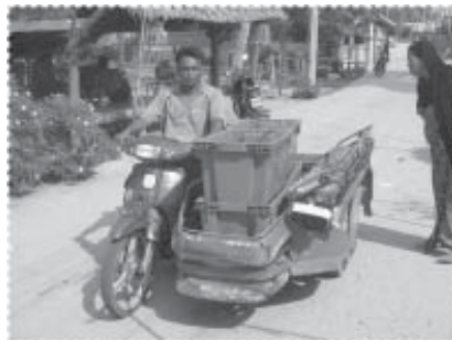
พ่ายขนส่งสินค้าและวัตถุดิบ

ในราวต้นปี พ.ศ. 2550 โครงการได้ทดลองนำเสนอสิ่งที้อาจเรียกว่านวัตกรรมใหม่ให้กับชุมชน หลังจากพบว่าสมาชิกบางส่วนมีความต้องการทางด้านสินเชื่อ โดยเฉพาะสินเชื่อสำหรับการพัฒนาอาชีพและการจัดซื้ออุปกรณ์ที่จำเป็นสำหรับใช้ในครัวเรือน ในขณะที่โครงการมีเงินกองทุนที่สะสมมาจากโครงการเลี้ยงปลา ที่พักว่างจากการเลี้ยงในบางฤดูอยู่จำนวนประมาณ 450,000 บาท ดังนั้นการเริ่มต้นของระบบไฟแนนซ์ชุมชนจึงเกิดขึ้นจากการหมุนเงินกองทุนก้อนดังกล่าว ภายหลังจากฝึกอบรมการปักจักรสำหรับผลิตผ้าคลุมผสมสตรีที่มีสมาชิกจำนวน 2 ราย ไม่มีเงินทุนสำหรับจัดซื้อจักรเย็บผ้า คณะกรรมการได้พิจารณาร่วมกันว่าควรจะจัดซื้อจักรเย็บผ้าให้แก่สมาชิกรายดังกล่าวโดยให้ผ่อนส่งคืน ในขณะที่เดียวกันมีสมาชิกที่ต้องการเงินทุนสำหรับจัดซื้อรถจักรยานยนต์เพื่อประกอบเป็นสามล้อพ่วงสำหรับขนส่งสินค้า และสมาชิกจำนวนหนึ่ง โดยเฉพาะผู้ที่ทำงานเป็นพนักงานในโรงงานข้าวเกรียบต้นแบบ ต้องการจัดซื้ออุปกรณ์เครื่องใช้ภายในบ้าน เช่น หม้อหุงข้าวไฟฟ้า ตู้เย็น ตู้เสื้อผ้า เป็นต้น ในการขอสินเชื่อนั้นผู้ขอไม่จำเป็นต้องใช้หลักทรัพย์ใดๆ ค่าประกันทั้งสิ้น การกำหนดวงเงินปล่อยกู้จะขึ้นอยู่กับมติของคณะกรรมการตามความน่าเชื่อถือของผู้กู้ และ