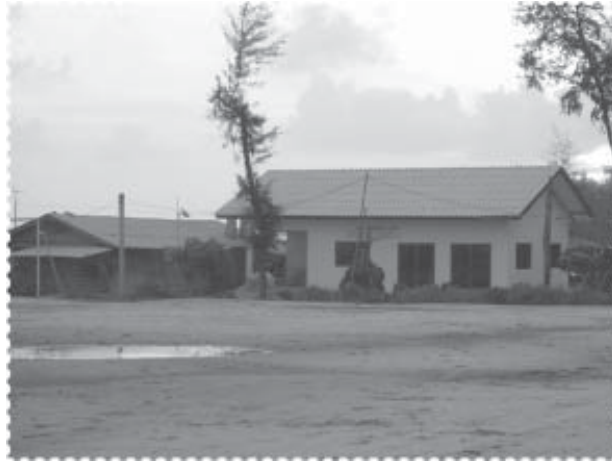
โรงงานแห่งใหม่ได้รับการสนับสนุนโดย ศอ.บต. โดยยังคงโรงงานเดิมอยู่ด้วย

มูลเหตุสำคัญของการสร้างรูปแบบการพัฒนานี้ขึ้นมา คือ การเริ่มต้นของโครงการที่ค่อนข้างเป็นไปโดยธรรมชาติ จากความต้องการที่จะสร้างอาชีพใหม่ขึ้นมาจริงๆ เพื่อแก้ไขปัญหาการว่างงาน ความยากจน และการดิ้นรนเพื่อหนีจากอาชีพการทำประมง ของชาวบ้านกลุ่มหนึ่งในหมู่บ้านปาตาบาระ ตำบลปะเสยะวอ อำเภอสาเยบุรี จังหวัดปัตตานี ในปี 2549 โครงการฯ ได้นำคณะผู้สนใจเข้าเยี่ยมชมการดำเนินงานวิสาหกิจชุมชนในหลายๆ พื้นที่ เช่น ชุมชนบางโรง จังหวัดภูเก็ต ชุมชนเขาคราม จังหวัดกระบี่ และผู้ประกอบการจัดทำของที่ระลึกสำหรับการท่องเที่ยว อำเภอละงู จังหวัดสตูล โดยในช่วงแรกได้ทดลองดำเนินการผลิตสินค้าต่างๆ เช่น จัดทำของที่ระลึก การผลิตขนม เป็นต้น แต่สุดท้ายสินค้าเหล่านั้นก็ยังไม่สามารถจัดเป็นการผลิตเชิงพาณิชย์ที่จะสร้างรายได้อย่างแท้จริงได้ ต่อมาได้มีการประชุมกลุ่มชาวบ้านอย่างต่อเนื่อง จนในที่สุดได้มีความคิดร่วมกันว่าน่าจะผลิตข้าวเกรียบปลา เนื่องจากมีแม่ค้าผู้ขายปลีกินค้าที่สามารถกระจายสินค้าไปยังตลาดนัด และพื้นที่ต่างๆ อยู่แล้ว แต่ปัญหาใหญ่ คือ แต่ละคนไม่เคยผลิตข้าวเกรียบปลามาก่อนเลย ทั้งๆ ที่ชุมชนแห่งนี้ตั้งอยู่บริเวณชายฝั่งทะเล จนได้มีการประสานงานขอไปศึกษาดูงานการผลิตข้าวเกรียบ