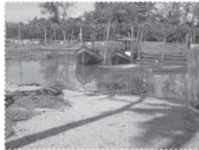
สภาพริมน้ำวันนี้ หลังจากได้รับการ ทำความสะอาดแล้ว...ดีขึ้นมาก