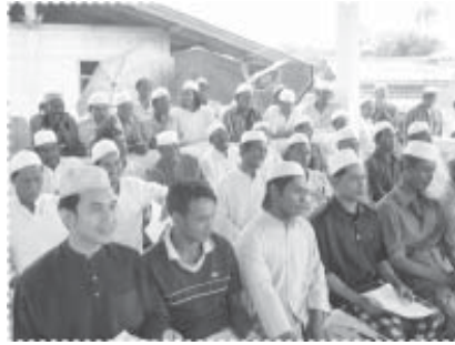
การอบรมให้ความรู้มีอยู่ทุกวันศุกร์ หลังละหมาดวันศุกร์