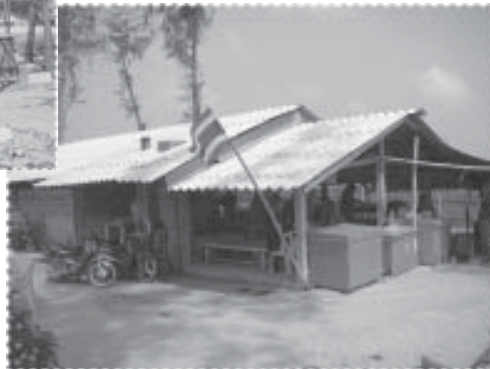
เราช่วยกันสร้างมากับมือ ☞