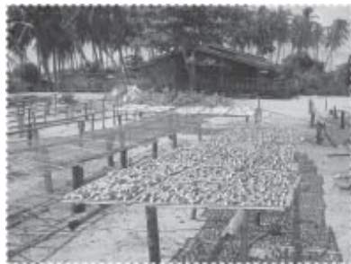
หนึ่งในอาชีพหลัก...ปลาตากแห้ง

พื้นที่อื่น และมีบุตรหลานสืบเชื้อสายหลายคนจนถึงปัจจุบัน ซึ่งแสดงว่าบ้าน ปาตาบาระมีอยู่ก่อนแล้ว อีกประการหนึ่งเมื่อเทียบกับเรื่องราวของชุมชน บางตะโล๊ะ ซึ่งมีความเกี่ยวข้องกับที่มาของศาลเจ้าในบางตะโล๊ะ ก็สันนิษฐาน ได้ว่าชุมชนแห่งนี้น่าจะมีอายุใกล้เคียงกันหรือเก่าแก่กว่าไม่มากนัก แม้ว่าเรื่องราว ของชุมชนบ้านปาตาบาระจะมีจุดเริ่มต้นไม่ชัดเจนนัก แต่ก็พอบ่งบอกที่มาที่ไป และพอที่จะเป็นฐานในการเชื่อมโยงถึงพัฒนาการของชุมชนในสมัยปัจจุบัน