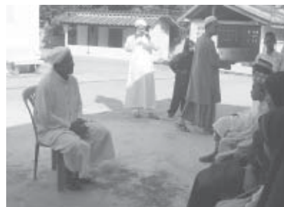
คอเต็บรอยะ กับเด็กกำพร้า

รอยะ อีเต ทุกๆ วันพี่น้องชาวปาตาบาระจะได้รับข่าวสารและความรู้ ต่างๆ ผ่านทางรอยะ อีเต คอเต็บและ ผู้อาวุโสประจำชุมชนที่มีทักษะทาง ดานวาทศิลป์ที่ดีที่สุด นอกจากทำหน้าที่ สอนอัลกุรอานให้แก่บุตรหลานและ เยาวชนในยามค่ำแล้ว รอยะ ในวัย 62 ปี จะเดินเท้าหรือไม่ก็ปั่นจักรยาน คู่ชีพไปทั่วชุมชนเพื่อพูดคุยกับชาวบ้าน