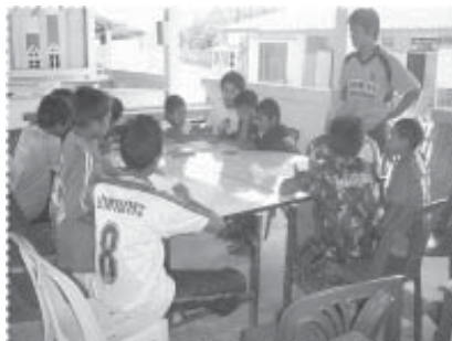
เด็กๆ ปรึกษาหารือ จะรักษาแม่น้ำอย่างไร