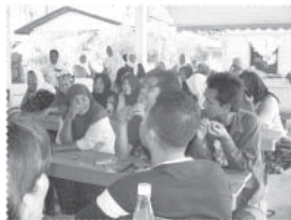
ร่วมประชุมหารือ เมื่อมีกิจกรรมที่จะต้องทำ