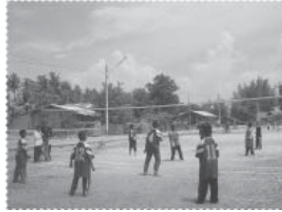
กีฬาเด็กๆ