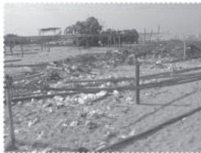
ที่ทิ้งขยะก่อนปลูกต้นสน

การสร้างเสริมสุขภาพหมู่บ้านประมง โครงการได้เน้นการทำให้ประชาชนมีความรู้เกี่ยวกับสุขภาพ อนามัย และสิ่งแวดล้อมเพิ่มขึ้นมาก จากการให้ความรู้โดยใช้วิธีการต่างๆ มีระบบการดูแลและป้องกันยูวชนและเยาวชนของหมู่บ้าน เพื่อให้ห่างไกลจากยาเสพติด มีการจัดการขยะที่ถูกต้อง โดยโครงการได้ประสานงานกับองค์การปกครองส่วนตำบลเพื่อให้มีการจัดการขยะ ทำให้เกิดมีระบบการจัดการขยะในพื้นที่ตำบลปะเสยะวอทั้งตำบล นอกจากนั้นแล้ว ยังดำเนินการจัดตั้งธนาคารขยะ เพื่อรับซื้อขยะที่มีมูลค่า เพื่อเป็นทางเลือกหนึ่งในการจัดการขยะและสร้างรายได้เสริมให้แก่เยาวชน มีกลุ่มเยาวชนอาสาสมัครดูแลจัดเก็บขยะของหมู่บ้าน พร้อมทั้งจัดทำป้ายรณรงค์ให้มีการทิ้งขยะเป็นที่เป็นที่ถูกทาง แม้ว่าขยะยังคงเป็นปัญหาอยู่ แต่ระดับของปัญหาถือว่าคลี่คลายลงมาก ปัจจุบันโครงการได้รวมคิดกับชาวบ้านเพื่อที่จะจัดสร้างเตาเผาขยะต้นแบบให้แก่หมู่บ้าน