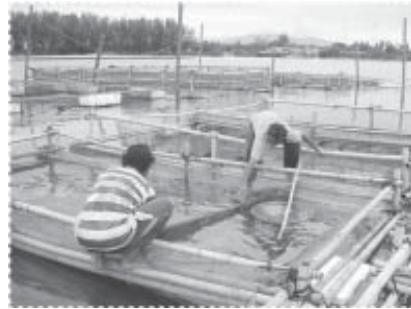
คนเลี้ยงปลา

หรือการทำเป็นอาชีพเสริมรายได้ของครอบครัว โดยมีผลการดำเนินงานของกิจกรรมต่างๆ ดังนี้ คือ การเลี้ยงปลาเพื่อเป็น ฟาร์มสาธิต และนำกำไรที่ได้เป็นรายได้ในการจัดการเรียนการสอนด้านศาสนา การดูแลเด็กกำพร้า ตลอดจนกิจกรรมสาธารณประโยชน์อื่นๆ หรือที่เรียกว่ากองทุนอามัลหมู่บ้าน ซึ่งเป็นกิจกรรมที่ประสบความสำเร็จอย่างยิ่ง โดยเฉพาะทางด้านการสร้างสำนึกความรับผิดชอบต่อสังคม ดังที่ได้กล่าวไว้แล้วในแผนงานที่ 3 ในส่วนผลที่ได้รับที่เกี่ยวข้องกับแผนงานนี้โดยตรง คือ การที่สามารถ