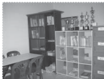
ภายในห้องสมุดโรงเรียนตาดีกา