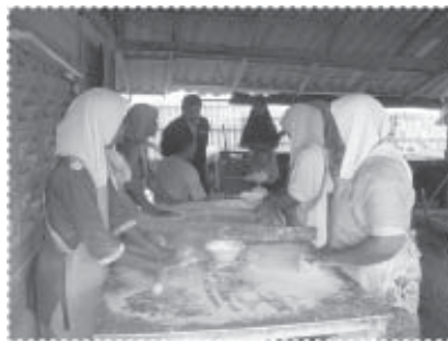
กระบวนการผลิตข้าวเกรียบสด

ในระยะแรกโรงงานได้เน้นการผลิตข้าวเกรียบแห้ง แต่ก็ประสบภาวะขาดทุน จนเงินทุนเริ่มร่อยหรอ แต่ด้วยความร่วมมือร่วมมือของชาวบ้านในชุมชน ทั้งกลุ่มพ่อค้าแม่ค้าของหมู่บ้าน ทั้งกลุ่มผู้ผลิต ต่างร่วมกันปรับปรุงและพัฒนา