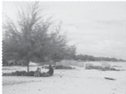
เมื่อต้นสนโตขึ้น...ความร่มรื่นก็ตามมา

การอนุรักษ์และฟื้นฟูทรัพยากรธรรมชาติและสิ่งแวดล้อม โครงการประสบความสำเร็จในการร่วมสร้างแหล่งอาศัยสัตว์ทะเลโดยใช้ภูมิปัญญาท้องถิ่น เพื่อเพิ่มพื้นที่ในการจับสัตว์น้ำของชาวประมง โดยสามารถผลักดันเข้าสู่นโยบายขององค์การบริหารส่วนตำบลในระยะต่อมา พร้อมกับการเล็งเห็นความสำคัญทางด้านนี้มากขึ้น ของสำนักงานประมงจังหวัดที่รับผิดชอบโดยตรง การปฏิรูปทัศนและการจัดกันพื้นที่ประมาณ 4 ไร่ ที่เคยเป็นพื้นที่ทิ้งขยะเดิมของหมู่บ้านมาปลูกต้นสนและต้นไม้อื่นๆ เพื่อใช้เป็นสวนสาธารณะของหมู่บ้าน สำหรับใช้เป็นแหล่งพักผ่อนหย่อนใจ และหลบแดดขณะวางแหหรือพักจากการทำประมง และสามารถกำบังลมพายุในช่วงฤดูมรสุมได้ จัดทำป้ายแสดงแผนที่ทางทะเลและแนวปะการังเทียม โดยเฉพาะที่สร้างโดยโครงการพระราชดำริเพื่อให้ความรู้แก่เยาวชนและประชาชนทั่วไป พร้อมทั้งสร้างสำนึกในพระมหากษัตริย์คุณ