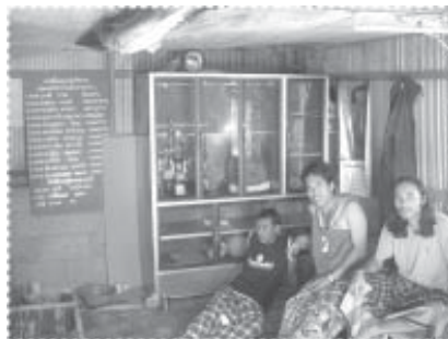
ชมรมกีฬาบ้านป่าตาวาระเกิดขึ้นแล้ว ที่กระท่อมเล็กๆ กลางหมู่บ้าน