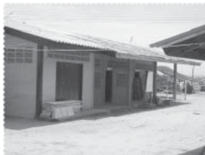
สภาพโรงเรียนตาดีกาที่เริ่มเปลี่ยนแปลง

การเพิ่มขีดความสามารถในการจัดการเรียนการสอนด้านศาสนาให้แก่ผู้สูงอายุและเด็ก จากการวิเคราะห์และประเมินว่าอะไร คือ ความต้องการสูงสุดของประชาคมในชุมชน ผลสรุป คือ การได้เรียนรู้ศาสนาและได้ปฏิบัติศาสนกิจตามที่ศาสนากำหนดอย่างถูกต้อง ซึ่งจะนำไปสู่การเป็นผู้ที่มีสภาพจิตใจที่ดีและเข้มแข็ง ทำให้โครงการให้ความสำคัญกับแผนงานนี้มากเช่นกัน โดยได้มีกิจกรรม