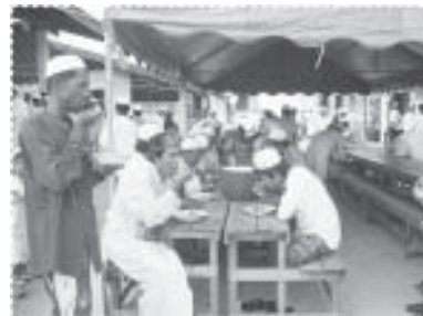
เราเสียดกันบ่อย