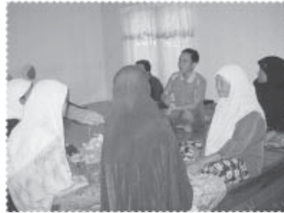
หารือกับทีมข่าวเกรียบ

ดังนั้นในปี 2551 จึงเพิ่มยอดวงเงิน สำหรับการปล่อยสินเชื่อเพื่อซื้อสินค้า เงินผ่อนเป็นเงิน 300,000 บาท สำหรับ ปล่อยกู้ให้สมาชิกจำนวน 35 ราย ใน การบริหารจัดการนั้น คณะกรรมการ กำหนดให้ผู้กู้จ่ายค่าสินค้าที่จัดซื้อ เดือนละครั้ง เป็นระยะเวลาตามที่