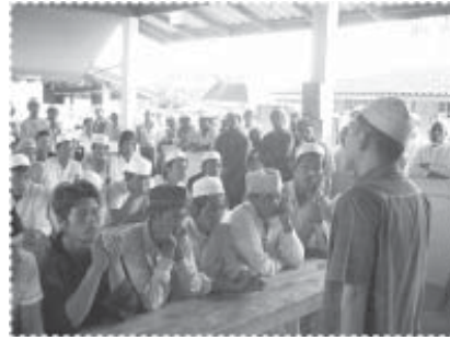
ประชุมกลุ่มวัยรุ่น