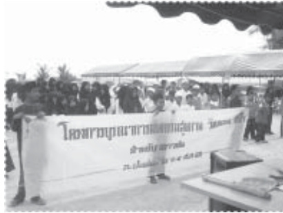
ขยายผลสู่ตำบล