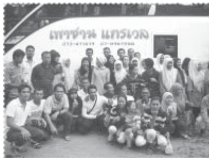
☞ คณะเพื่อการแลกเปลี่ยนเรียนรู้

ขั้นที่ 2 จัดกิจกรรมต่างๆ ในลักษณะของการเปิดโอกาสให้ชาวบ้านมีส่วนร่วมมากยิ่งขึ้น มีเวทีการประชุม สัมมนาเชิงปฏิบัติการ การพูดคุยตามแหล่งรวมตัวของประชาคม เช่น มัสยิด ร้านน้ำชา พร้อมทั้งจัดสร้างแหล่งสำหรับการรวมตัวของประชาคมเพิ่มเติม เช่น ศาลาที่โครงการจัดสร้างและปรับปรุงในขณะเดียวกันโครงการได้เริ่มกำหนดกรอบ และรูปแบบในการทำกิจกรรมอย่างคร่าวๆ ผ่านเวทีการปรึกษาหารือทั้งที่เป็นทางการและไม่เป็นทางการ โดยที่พบว่าจำนวนกิจกรรมส่วนใหญ่จะเกิดจากการพูดคุยในเวทีที่ไม่เป็นทางการพร้อมๆ กับการปรับสภาพของประชาคมให้มีความพร้อมในการดำเนินงาน ในขณะเดียวกันในช่วงนี้โครงการจำเป็นต้องสร้างรูปธรรมต่างๆ ที่ประชาคม