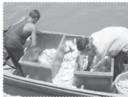
ปลาฉลามแดงที่จับได้ หลังจากที่เลี้ยงมา 5 เดือน

การสร้างเสริมสุขภาพกายและใจ โครงการได้จัดกิจกรรมเพื่อทำให้ประชาชนมีความรู้เกี่ยวกับสุขภาพ อนามัย และสิ่งแวดล้อมเพิ่มขึ้นมากอย่างต่อเนื่องจากระยะที่ 1 จากการให้ความรู้โดยใช้วิธีการต่างๆ สร้างกระแสการลดอัตราการสูบบุหรี่อย่างต่อเนื่อง ให้ความรู้ทางด้านการปรับเปลี่ยนพฤติกรรม การบริโภคที่เสี่ยงต่อการเกิดโรคต่างๆ ส่งเสริมการออกกำลังกาย และการดำเนินงานของทีมกีฬาประจำหมู่บ้าน และการปรับปรุงสนามเด็กเล่นประจำหมู่บ้าน สนับสนุนและสร้างกระแสให้มีการออกกำลังกายอย่างต่อเนื่อง พร้อมทั้งผลักดันให้เป็นกิจกรรมประจำปีที่อยู่ในแผนงานขององค์การบริหารส่วนตำบล