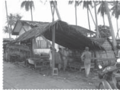
ชาวบ้านออกแรง โครงการออกทุน ช่วยกันสร้างศาลาพักผ่อนรับทาง

การมีส่วนร่วมของประชาชน นับว่าเป็นหัวใจหลักที่สำคัญที่สุดในการขับเคลื่อนโครงการ แม้ว่าจะต้องดำเนินงานภายใต้ความขัดแย้งในการนำของหมู่บ้าน แต่โครงการได้จัดวางกระบวนการมีส่วนร่วมโดยเน้นให้มีความครอบคลุมให้มากที่สุด การจัดวาง บทบาท ของผู้นำหมู่บ้านทั้งกำนัน สมาชิกองค์การบริหารส่วนตำบล และผู้นำศาสนา ให้ถูกต้องและดำเนินการในลักษณะของการให้เกียรติ ทำให้โครงการได้รับความร่วมมือจากกลุ่มผู้นำต่างๆ เป็นอย่างดี อย่างไรก็ตามกลุ่มที่มีบทบาทมากที่สุดในการขับเคลื่อนโครงการ คือ คณะกรรมการบริหารมัสยิด ผู้นำทางธรรมชาติของหมู่บ้าน กลุ่มครูสอนศาสนา กลุ่มสตรีและเยาวชน นอกจากนั้นโครงการยังทำหน้าที่เป็นตัวกลางเพื่อที่จะเชื่อมประสานความไม่ลงรอยกันระหว่างกลุ่มผู้นำของหมู่บ้าน เพื่อขับเคลื่อนหมู่บ้านไปสู่เป้าหมายที่ได้วางไว้ การประชุมปรึกษาหารือ การร่วมทัศนศึกษาดูงาน แลกเปลี่ยนเรียนรู้กับพื้นที่ต่างๆ ทำให้ประชาคมเริ่มที่จะเห็นความสำคัญของการทำงานโดยกลุ่ม ที่ดำเนินงานในลักษณะของการร่วมปรึกษาหารือมากขึ้น มีการพูดคุยเกี่ยวกับปัญหาและวิธีการแก้ไขปัญหาสำหรับหมู่บ้านมากขึ้น ชาวบ้านร่วมมือในการ ปรับปรุงและก่อสร้าง อาคาร และบริเวณต่างๆ รอบมัสยิดและโรงเรียนตาดีกา เช่น การร่วมกันสร้างรั้วของโรงเรียนตาดีกา การปรับปรุงทาสีมัสยิดและโรงเรียนตาดีกา การร่วมกันสร้างห้องพัสดุและหอกระจายข่าวของหมู่บ้าน กิจกรรมต่างๆ ที่ได้ดำเนินการไปทั้งหมดนั้น โครงการเป็นเพียงแค่ผู้ทำ