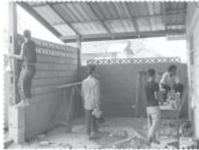
ร่วมกันสร้างห้องพัสดุและหอกระจายข่าว ของหมู่บ้าน