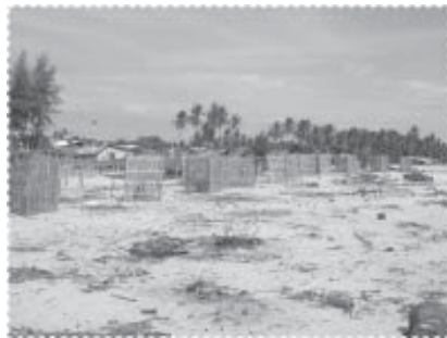
ต้นสนที่ร่วมกันปลูกตลอดแนวชายฝั่ง และรอยเหาะใหม่ขงที่ทิ้งขยะ