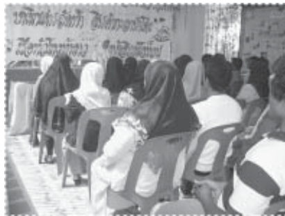
แลกเปลี่ยนเรียนรู้ที่กระบี่