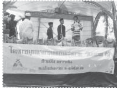
กิจกรรมเยาวชน