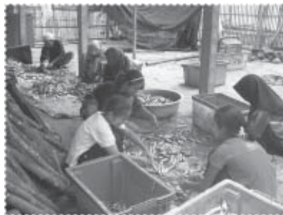
พนักงานเตรียมปลาสด

พนักงานและคณะกรรมการบริหารในแต่ละปี ปัจจุบันพบว่ารายได้จากการจำหน่ายส่วนของหัวปลา สำหรับใช้เป็นอาหารเลี้ยงปลากะพงขาวที่มีการเลี้ยงอยู่มากมายในพื้นที่นั้น สร้างรายได้ให้ระบบสวัสดิการมากกว่า 12,000-15,000 บาทต่อเดือน ซึ่งรายได้ส่วนนี้จะถูกนำไปใช้จัดสรรเป็นสวัสดิการต่างๆ มุ่งเน้นที่การบริจาคให้แก่ผู้สูงอายุและผู้ยากไร้ในชุมชน การจัดสรรเป็นทุนการศึกษาสำหรับเด็กกำพร้าและผู้ที่มีผลการเรียนดีของชุมชน การใช้เป็นเงินค่าตอบแทนครูสอนศาสนา การปรับปรุงมัสยิด โรงเรียนตาดีกา ศาลาพักผ่อนประจำหมู่บ้าน การจัดซื้ออุปกรณ์สำหรับใช้ในสนามเด็กเล่น การจัดกิจกรรมสำหรับเยาวชน เป็นต้น จนนับว่าเป็นเครื่องมือสำคัญของการสร้างความเข้มแข็งขึ้นมาในชุมชนเต็มรูปแบบร่วมกับกิจกรรมอื่นๆที่เกิดขึ้นในชุมชน เช่น กองทุนเลี้ยงปลากะพงขาว ระบบไฟแนนซ์ชุมชน เป็นต้น สิ่งต่างๆ เหล่านี้ได้นำไปสู่การแก้ไขปัญหา