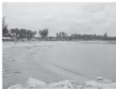
..บ้านป่าตาบาระ..

ปัจจุบันชุมชนบ้านป่าตาบาระ ประกอบด้วยสมาชิก 178 ครัวเรือน ประชากรรวม 918 คน ส่วนใหญ่นับถือศาสนาอิสลาม ร้อยละ 70 ประกอบอาชีพทำการประมงทะเล โดยมีอาชีพเสริม คือ การเลี้ยงปลากะพงขาว การทำปลากะตักต้มตากแห้ง ค้าขาย บักฝาคูล์มม นอกจากนี้มีอุตสาหกรรมในครัวเรือน เช่น การทำปลาแห้ง ปลาเค็ม นูดู ค้าขาย รับจ้าง อย่างไรก็ตามอาชีพการทำประมงได้ลดความสำคัญลงเป็นลำดับในเวลาต่อมา