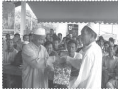
เพื่อนๆ มาเยี่ยมเรา