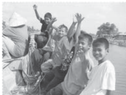
เด็กๆ ล่องเรือดูสภาพคลองสายบุรี