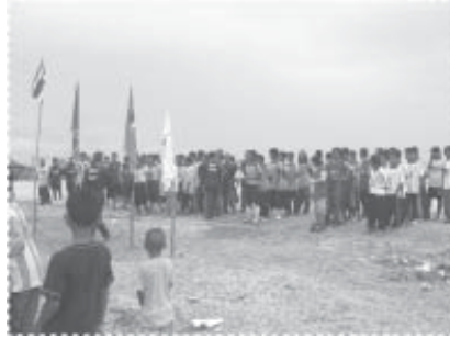
พิธีเปิดการแข่งขันกีฬาหมู่บ้าน