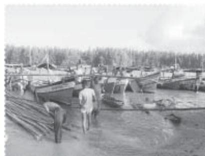
เรือร้อมนำซั้งไปวางในทะเล