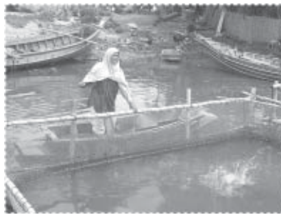
บ่อกีเลี้ยงปลา

ทับทิม แทนที่การเลี้ยงปลาทับทิมเพียงอย่างเดียว โดยจัดให้ผู้สนใจเข้าร่วมเลี้ยงปลากะพงขาวจำนวนทั้งสิ้น 10 ราย ในปี 2549 และ 2551 ฟาร์มชุมชนมีผลประกอบการที่เป็นกำไรสามารถจัดแบ่งผลกำไรให้แก่ผู้เลี้ยงประมาณ 40,000 บาท และจัดสรรเป็นระบบสวัสดิการชุมชนจำนวนหนึ่ง ในขณะที่ปี 2551 ผลปรากฏว่าได้เกิดปัญหาน้ำเสียในลำคลองที่เลี้ยงอย่างมาก ปลากะพงขาวตาย ทำให้กิจกรรมการเลี้ยงปลาประสบภาวะการขาดทุนประมาณร้อยละ 10 ของต้นทุนที่ใช้ในการเลี้ยงทั้งหมด แต่โครงการยังคงสนับสนุนให้มีการเลี้ยงปลาอยู่บ้าง ในบริเวณที่มีการไหลเวียนของน้ำในลำคลองได้ดี เนื่องจากการเลี้ยงปลากะพงขาวเป็นอาชีพที่สำคัญของประชาชนในหมู่บ้านแห่งนี้