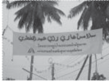
สุขสันต์วันรายอฮิดลฮัจญ์