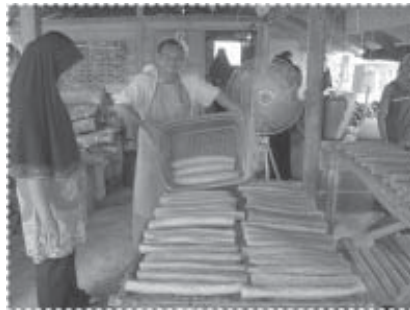
ผลิตภัณฑ์ของเรา

สูตรข้าวเกรียบและจัดหาตลาด จนในที่สุดได้ทดลองผลิตข้าวเกรียบสด หรือที่รู้จักกันในชื่อ “กะโป๊ะ หรือ ปลาออกกะโป๊ะ” ด้วยรสชาติที่อร่อย รสเข้มข้น มีสัดส่วนเนื้อปลาต่อแป้งมากกว่าข้าวเกรียบสดที่จำหน่ายทั่วไป ในท้องตลาด ส่งผลให้ข้าวเกรียบสดบ้านปาตาบาระ ติดตลาดอย่างรวดเร็ว แม้ว่าในช่วงแรกผู้ค้าปลีกจะแจ้งแก่ลูกค้าว่าเป็นข้าวเกรียบจากนราธิวาส เพื่อทำการตลาด ในช่วงแรกราวเดือนสิงหาคม 2549 มีการผลิตเพียงวันละประมาณ 30-50 กิโลกรัม มีพนักงานที่ร่วมกันก่อตั้งเพียง 4 คน มีรายได้วันละประมาณ 50-100 บาทต่อคน