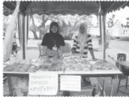
เราออกร้านทั่วประเทศ