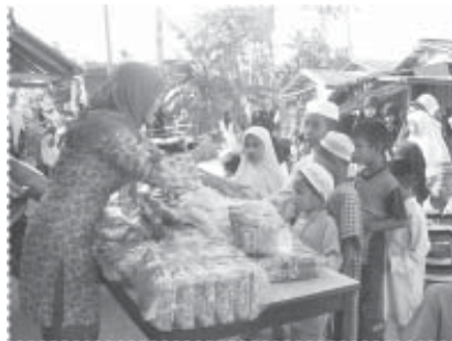
แจกเด็ก ๆ