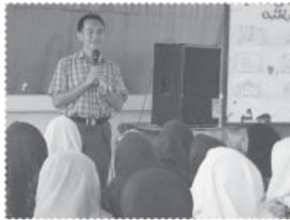
ซีแจงบ่อยๆ