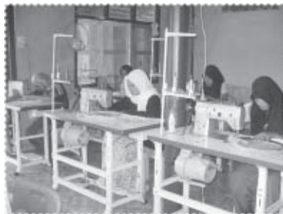
ฝึกอาชีพปักจักร...ทำผ้าคลุมพรม

ในระยะที่ 1 โครงการได้กำหนดแนวทางการพัฒนาอาชีพการทำผ้าคลุมพรมสตรี และได้นำมาดำเนินการจริงในระยะที่ 2 โดยในเดือนธันวาคม 2549 โครงการได้เลือกผู้สนใจจำนวน 15 คน เข้าร่วมฝึกอบรมเทคนิคการปักจักรเพื่อทำผ้าคลุมพรมสตรีจำนวน 45 วัน โดยเลือกเอาผู้ที่ประกอบอาชีพทางด้านนี้ของหมู่บ้านเป็นวิทยากรและประสานงานใช้จักรเย็บผ้าที่จัดซื้อโดยองค์การบริหารส่วนตำบลปะเสยะวอ ซึ่งได้จัดซื้อมาหลายปีแล้ว แต่ยังไม่มีการใช้งานแต่ประการใด จนผู้เข้ารับการอบรมจำนวน 10 ราย