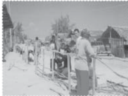
ช่วยกันสร้างรั้วไม้ไต้มัธยม